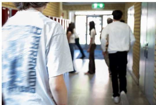
Bilden är arrangerad.

Det är mycket vanligt att barn och ungdomar delar bilder och filmer med varandra, via digitala plattformar som Snapchat och Tiktok eller på så kallade exposekonton (via länken nedan hittar du en film som beskriver vad exposekonton är).